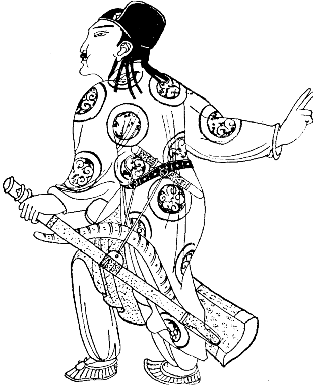
3. kép. Ujgar harcos 9. századi keletturkesztáni falfestményről (Le Coq után.)

möött lóba belevarrják szívének és májának egy-egy darabkáját is. Hitük szerint, ha vigyáznak arra, hogy megnyúzáskor és sírbatételkor a ló csontjait semmi sérülés ne érje, akkor ez a ló épségben fogja a tulsó életben szolgálni gazdáját. Csupán hasonló kitöméssel magyarázhatjuk azt, hogy a Zápolya-utcai sírban a ló különálló csontjai olyan rendben feküdtek, mintha az egész lovat eltemették volna. A kitömés mellett szól még az a néprajzi párhuzam