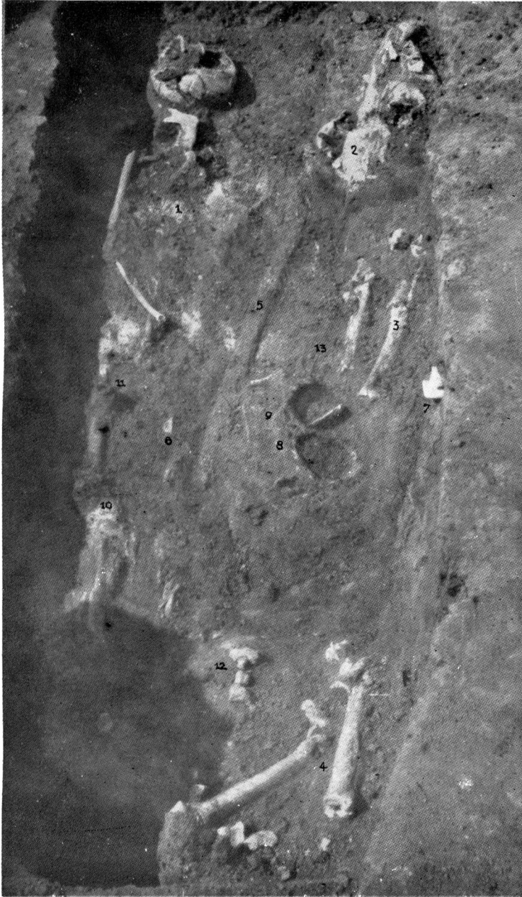
2. kép. Kolozsvár-Zápolya-utcai honfoglaláskori temető 10. sírja. (1942. évi ásatás.)