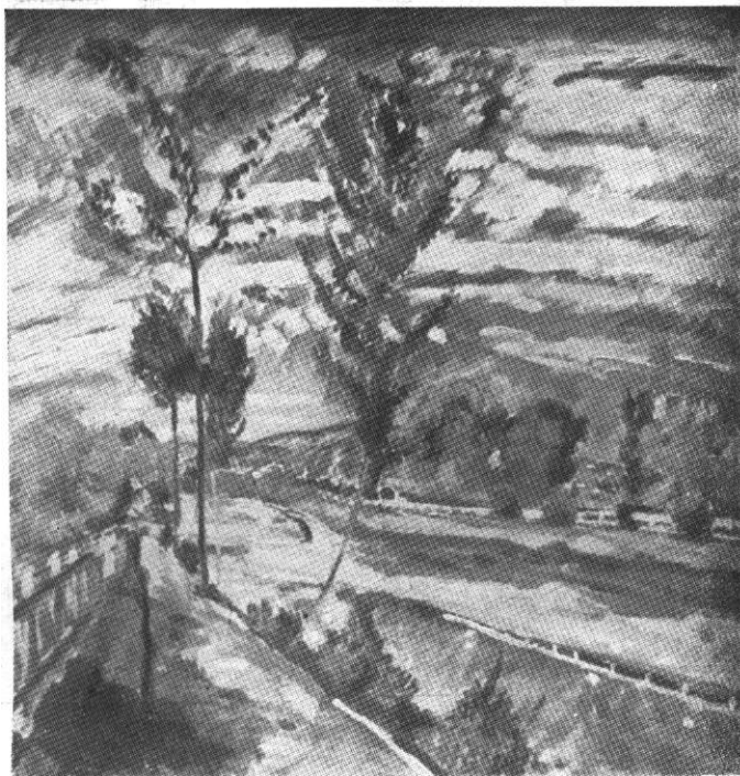
Szolnay Sándor: Szeptember (olajfestmény)