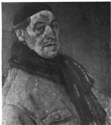
Mohi Sándor: Önarckép (olajfestmény)