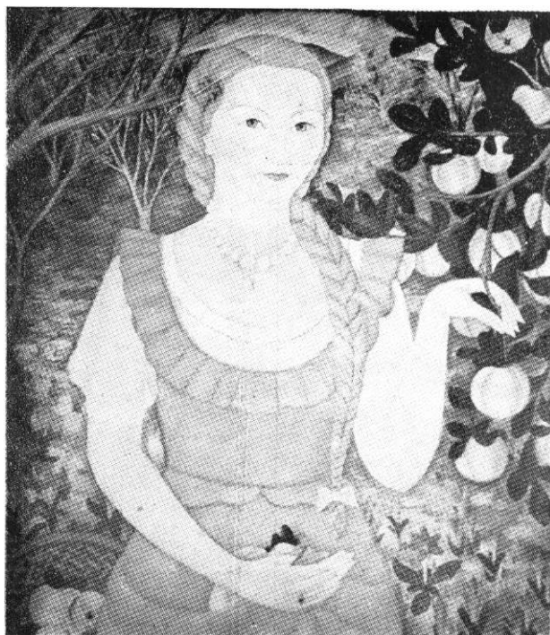
Fülöp Antal Andor: Birsalmát szedő leány (olajfestmény)