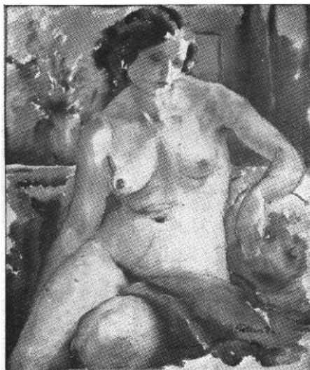
A. Tollas Júlia: Akt (vízfestmény)